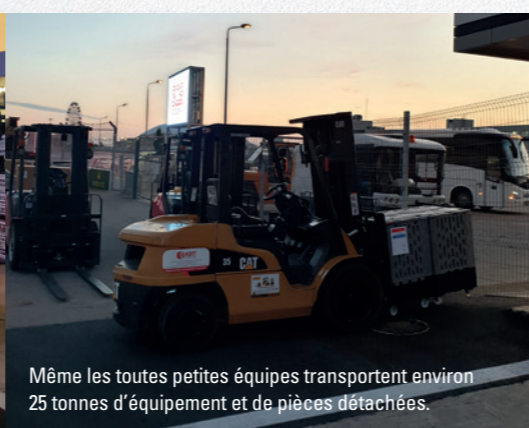
Même les toutes petites équipes transportent environ 25 tonnes d'équipement et de pièces détachées.

« En Formule 1, il n'y a pas de place pour l'erreur. La logistique et les compétences de planification technique sont très importantes ! »