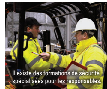
Il existe des formations de sécurité spécialisées pour les responsables.