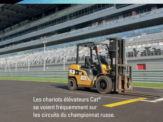
Les chariots élévateurs Cat® se voient fréquemment sur les circuits du championnat russe.