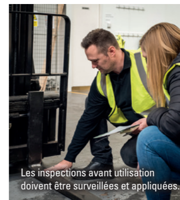
Les inspections avant utilisation doivent être surveillées et appliquées.