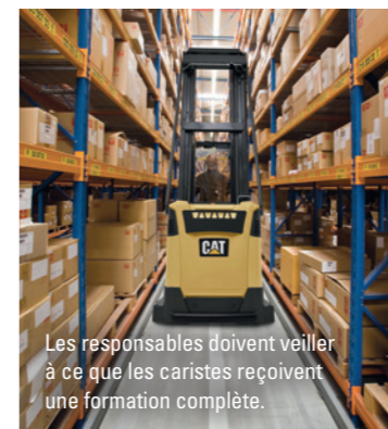
Les responsables doivent veiller à ce que les caristes reçoivent une formation complète.