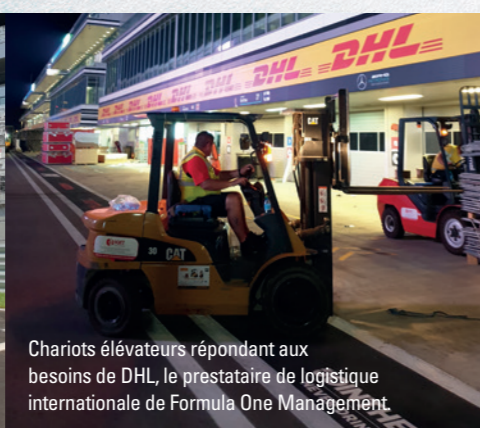
Chariots élévateurs répondant aux besoins de DHL, le prestataire de logistique internationale de Formula One Management.